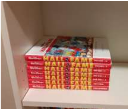
Jeg legger bøkene i hylla. Bøkene ligger i hylla.

Når vi setter en ting et sted, står tingen der etterpå. Når vi legger noe et sted, sier vi at tingen ligger der.