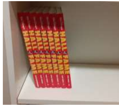
Jeg setter bøkene i hylla. Bøkene står i hylla.