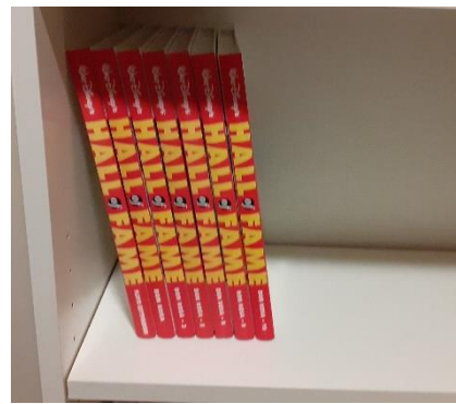
Jeg legger bøkene i hylla. Bøkene ligger i hylla.